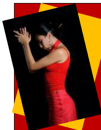
el baile / la danza

La danza es la coordinación de movimiento en forma estética.