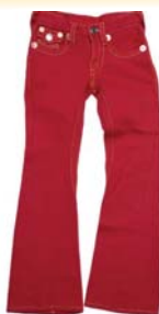
Preis: 30 Euro Farben: rot, blau, lila, grün