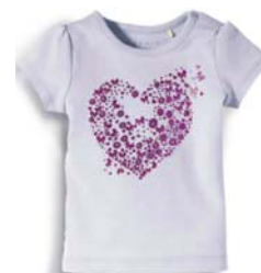
Preis: 10 Euro Farben: weiß, blau, rosa