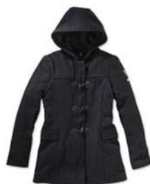
Preis: 65 Euro Farben: schwarz, grau, braun