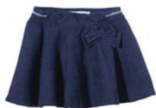
Preis: 40 Euro Farben: orange, lila, gelb