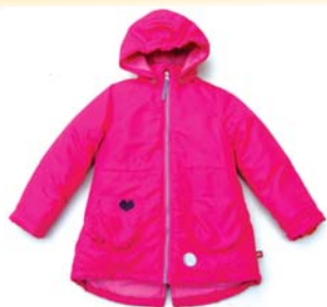
Preis: 55 Euro Farben: rosa, blau, schwarz