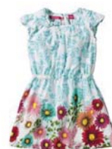
Preis: 24 Euro Farben: weiß, grün, rot, blau