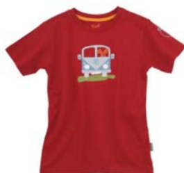
Preis: 18 Euro Farben: blau, schwarz, grün