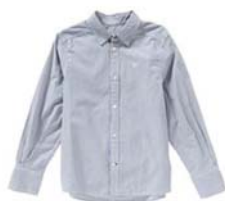
Preis: 17 Euro Farben: weiß, schwarz, blau